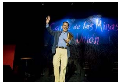
Fernando Sánchez Dragó saluda al público de La Unión.